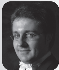
指揮 ヴィート・クレメンテ

作曲：ジャコモ・プッチーニ 原作：アンリ・ミュルジェ 台本：ジュゼッペ・ジャコーザ／ルイージ・イツリカ