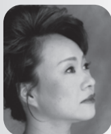
ミミ 佐藤 美枝子