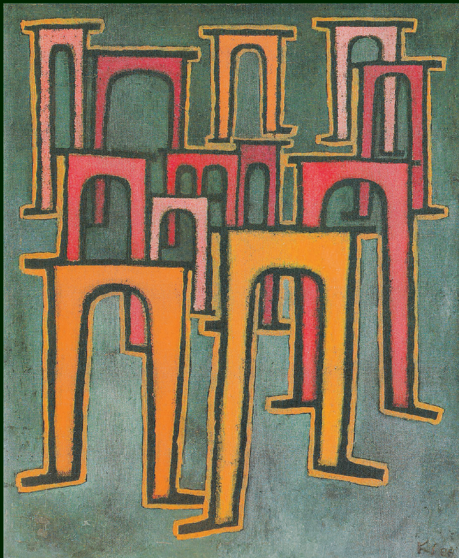
パウル・クレー 陸橋の革命、1937、133 Hamburger Kunststhalie

2022年12月17日(土) 18日(日) オペラ 和光市民文化センター 大ホール TEL 048-468-7771 開演 14:00 開場 13:15 ●秩父銘仙展 ロビー展示